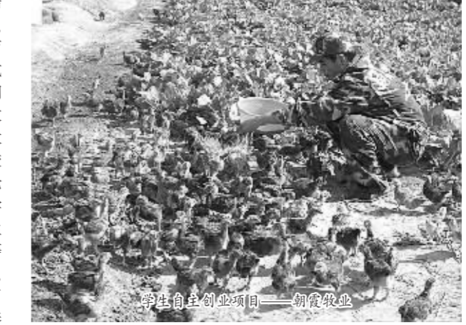
学生自主创业项目——朝霞牧业

——在校内建设示范性实训基地，实施产学研活动。凭借学院多年科技优势，坚定地在校内推进教师、工人、学生三结合，教学、科研、生产一体化建设，教学、科技、生产三个效益兼顾的经营策略，收到了很好的效果。现建有校内教学服务型实训基地13个，科研主导型实训基地12个，生产实训型实训基地15个，自主创业型实训基地6个。特别是在示范院建设中，我们按照“为农民提供生活模式、为农业提供生产模式、为农村提供发展模式”的思路建设实训基地，把实训基地的功能扩展到科技推广普及、生产生活示范、旅游休闲观光等，已经显示出了示范效果。